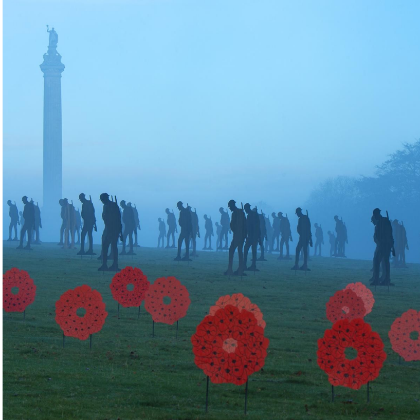
Standing with Giants op Blenheim Palace

Een laatste voorbeeld ziet men in Engeland hier heeft kunstenaar Dan Barton een indrukwekkende installatie gebouwd. De installatie Standing with Giants heeft al op verschillende locaties gestaan, zoals bijvoorbeeld Blenheim Palace. Gerecycled bouw materiaal is hierbij vervaardigd tot grote figuren van soldaten en klaprozen. 44 Hoewel het hier om een herdenking van de Eerste Wereldoorlog gaat, is het toch goed om naar dit voorbeeld te kijken. Deze silhouetten in het landschap leveren een indrukwekkend beeld op en zetten aan tot nadenken en herdenken. Bij Standing with Giants komen herdenken en kunst in het landschap samen.