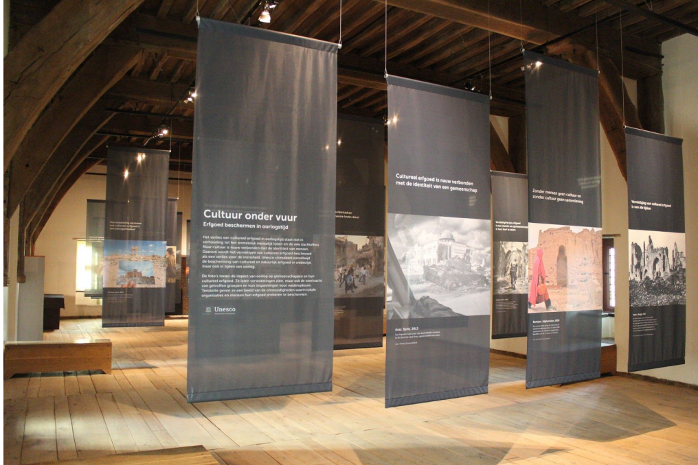
Fototentoonstelling bij Cultuur onder vuur