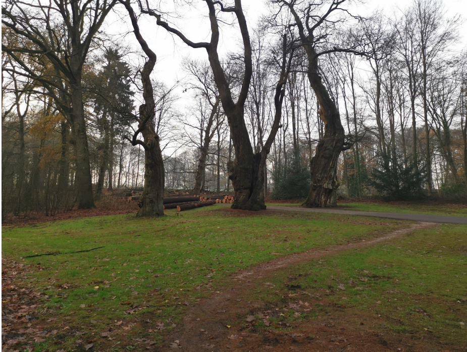
De drie monumentale eiken met daarachter rechts de locatie van de voormalige rentmeesterswoning