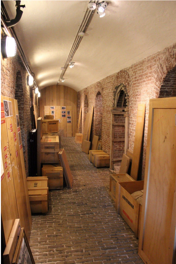
De tentoonstelling

de bezoeker hierbij wordt gesteld is waarom cultureel erfgoed volgens hun beschermd moet worden.