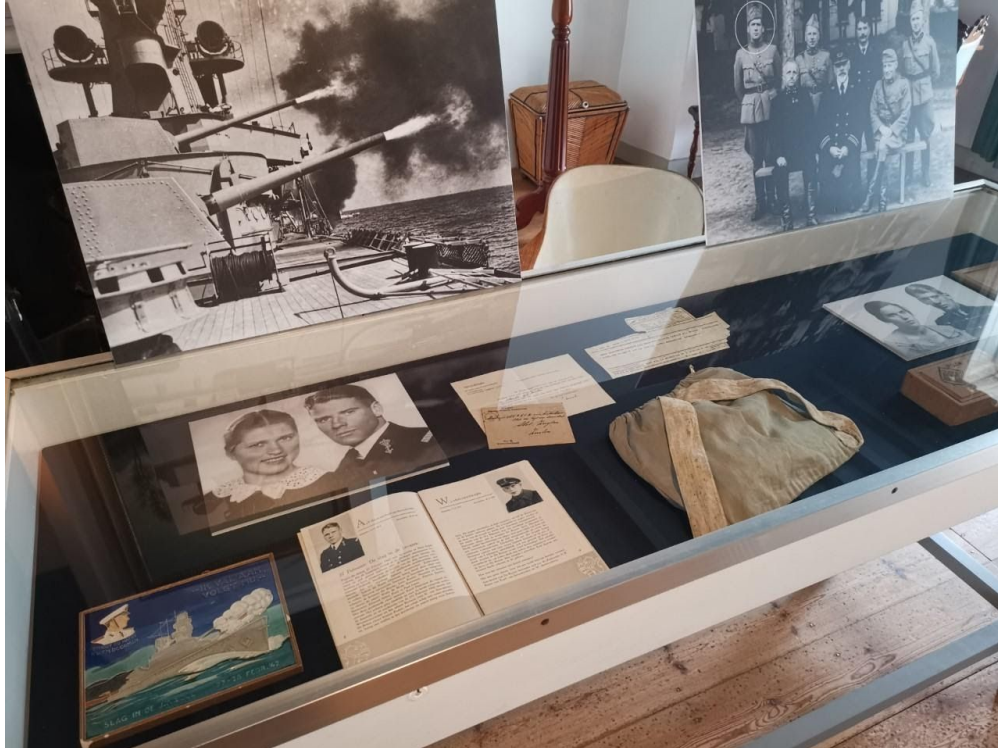
Vitrine in logeerkamer met foto's, brieven en objecten van de twee zoons en hun gezin.