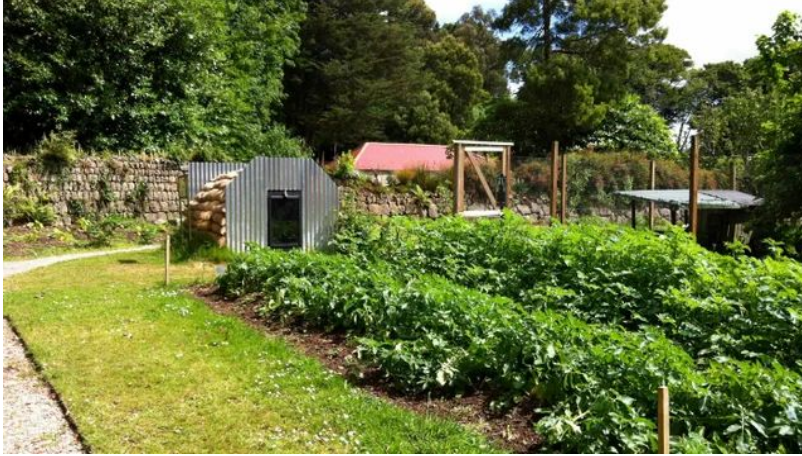
reconstructie WOII groentetuin Trengwainton

Het landhuis Hughenden speelde ook een bijzondere rol in de Tweede Wereldoorlog. Op dit huis in Buckinghamshire bevond zich in de oorlogsjaren een geheime cartografie afdeling van het Britse leger. In de kelder van Hughenden heeft een tentoonstelling over deze periode plaatsgevonden. Door middel van foto's werd de situatie van tijdens de oorlog getoond. Op deze foto's was te zien hoe het oude interieur van het huis is vervangen door grote werktafels van de kaartenmakers. Volgens Ben Cowell, die een blog over deze tentoonstelling schreef was de tentoonstelling in de kelder net zo populair als de vaste tentoonstelling in de rest van het huis. Dit laat volgens Cowell de behoefte onder het publiek naar Tweede Wereldoorlog verhalen zien. 58