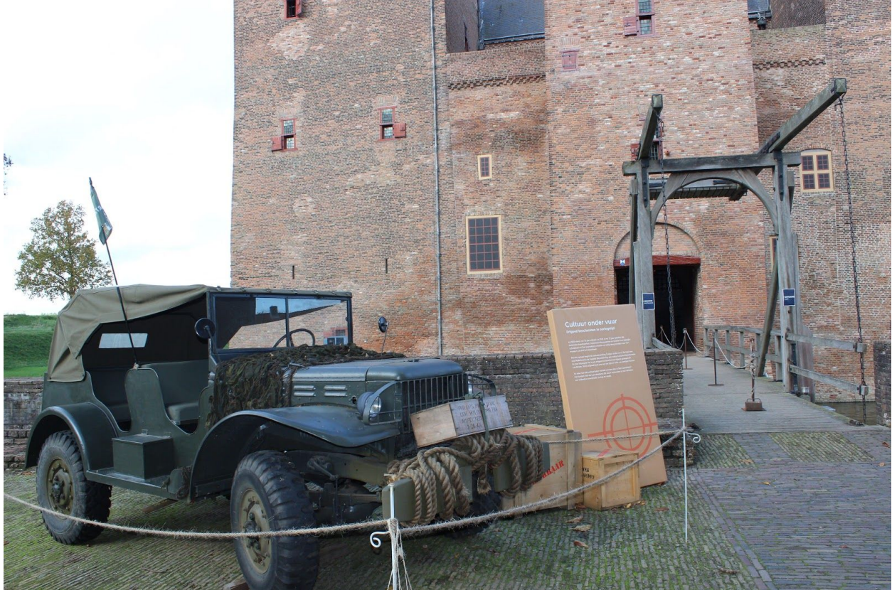
Start van tentoonstelling Cultuur onder vuur