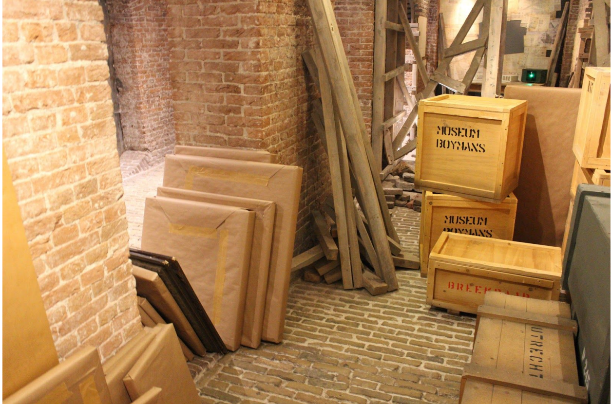
Namaak kunst en archiefmateriaal