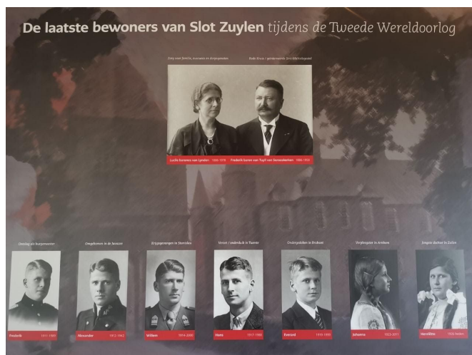
Stamboom van gezin die in het begin van tentoonstelling getoond wordt.

In de logeerkamer komt de bezoeker meer over de twee zoons van de barones, Alexander en Willem, te weten. Alexander kwam tijdens de oorlog om op de Javazee. Zijn vrouw Angelika en hun kind werden in een jappenkamp gevangen gehouden. In een vitrine worden hier bepaalde originele objecten getoond. Er liggen onder andere brieven, telegrammen en het rugzakje dat Angelika tijdens haar tijd in het kamp bij zich droeg.