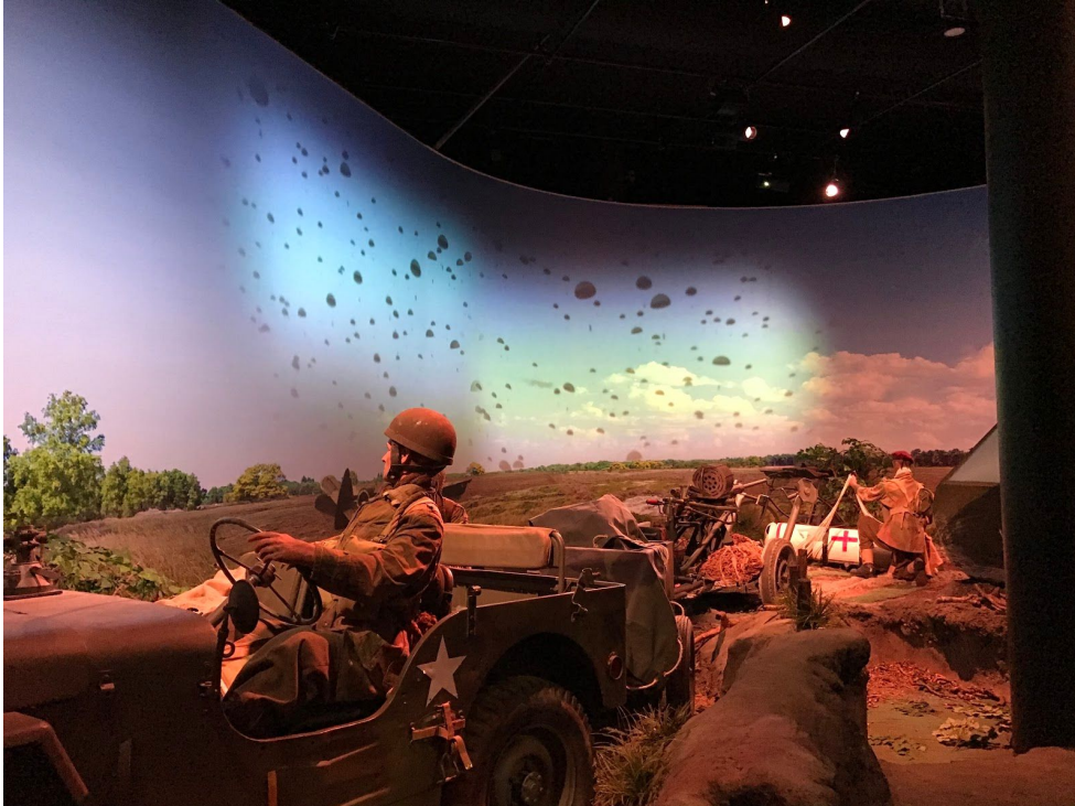
onderdeel van de Airborne Experience

De nadruk wordt in de Airborne Experience gelegd op het heldendom van de jonge geallieerden soldaten en de Duitse soldaten worden als het ultieme kwaad neergezet. Zo lijkt zelfs de gezichtsuitdrukking op de poppen van de Duitse soldaten gemeen ten opzichte van die van de geallieerden poppen. Het kwaad wordt hier tegenover het goede gezet. Dit zwart wit denken is juist iets dat bij het Tweede Wereldoorlog verleden niet altijd juist is. Hier zou het Airborne museum zorgvuldiger mee om moeten gaan. De Airborne Experience richt zich teveel op de sensatie van de bezoeker.