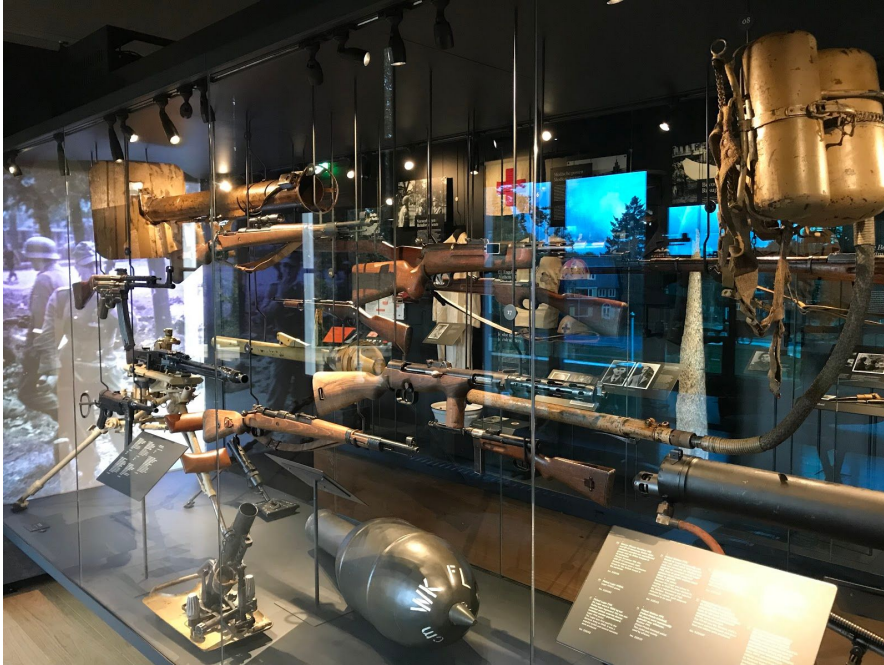
vitrine met wapens in villa Hartenstein, zelfgemaakte foto

Tot slot eindigt de bezoeker het bezoek met de Airborne Experience in de kelder van de villa. In deze Airborne Experience komt men op een theatrale wijze in de schoenen van Britse soldaten tijdens de slag om Arnhem te staan.