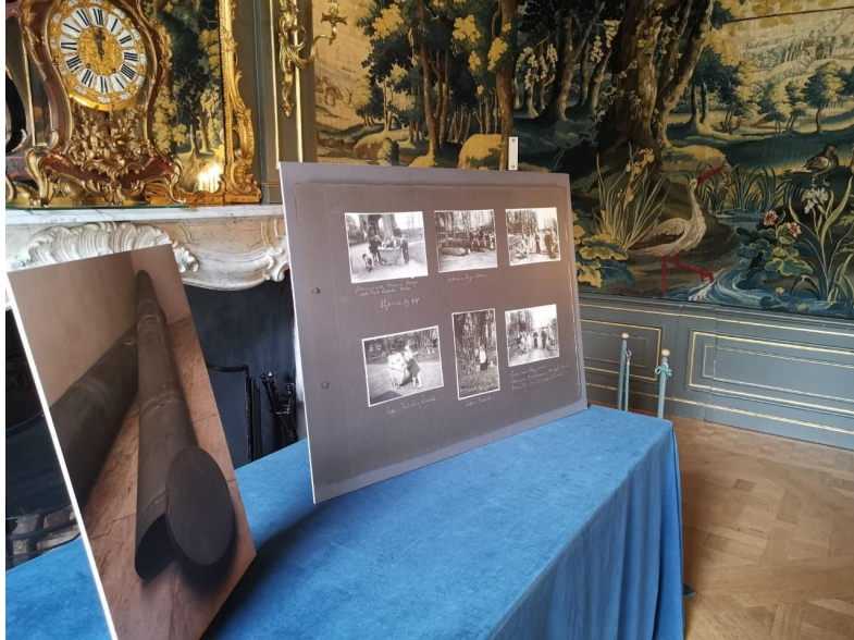
Tentoonstellingstafel in Gobelinzaal met daarop o.a. een foto van de kokers waarin het wandtapijt werd veiliggesteld.