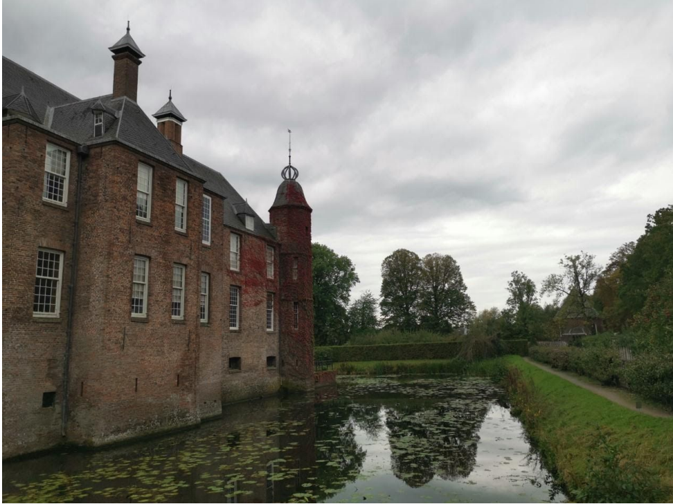
Slot Zuylen met gracht en tuin.