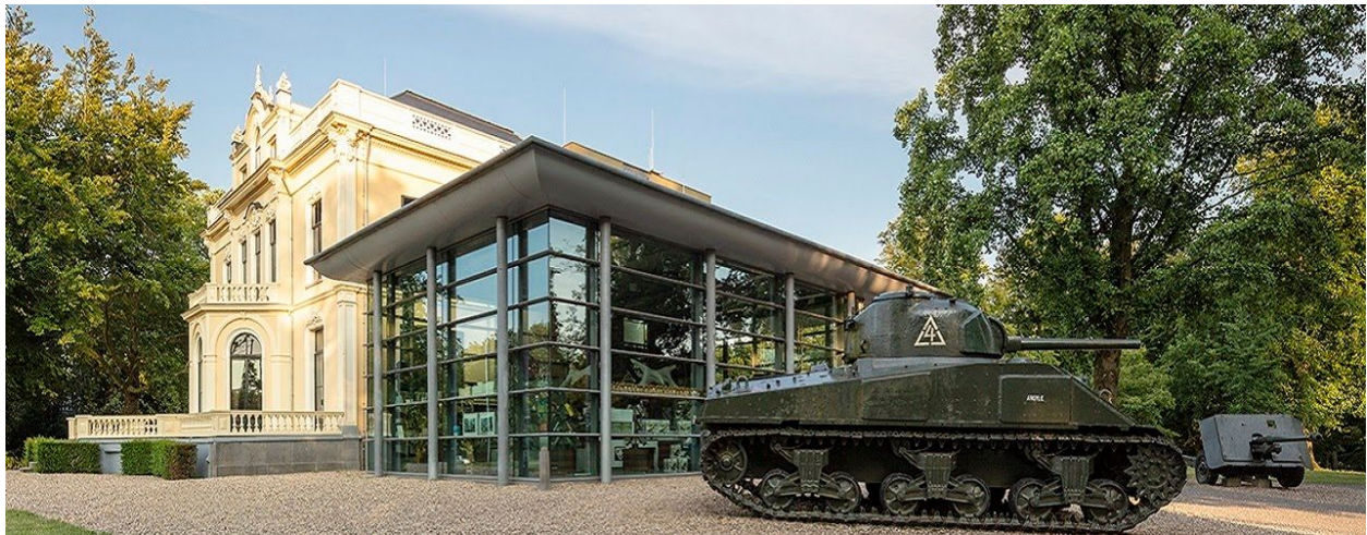
Tank voor villa Hartenstein en entreegebouw

Naast de tentoonstelling binnenshuis organiseert het Airborne museum ook enkele activiteiten buiten de muren van villa Hartenstein. Een voorbeeld hiervan is de perimeterwandeling. Men treed hierbij als wandelaar in de voetsporen van geallieerden soldaten. 33 Met name in september worden er veel andere evenementen door het museum georganiseerd, waarvan sommige met een groot reenactment karakter hebben.